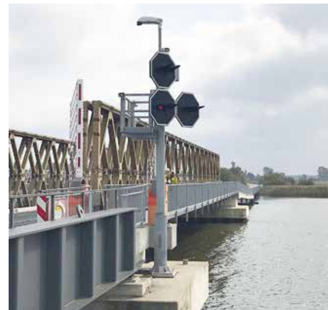
Schleusensignalgruppe mit Schifffahrtssignalmast Hindrik und 6 Schleusensignallaternen S 145 LED